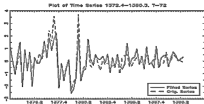
نمودار ۲: مقایسه مقادیر اصلی و مقادیر برآورد شده متغیر وابسته