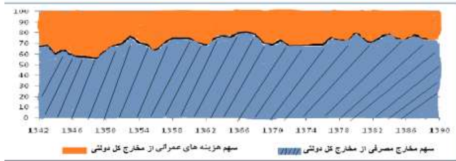
شکل ۱: درصد هزینه‌های مصرفی و عمرانی از هزینه‌های کل دولت