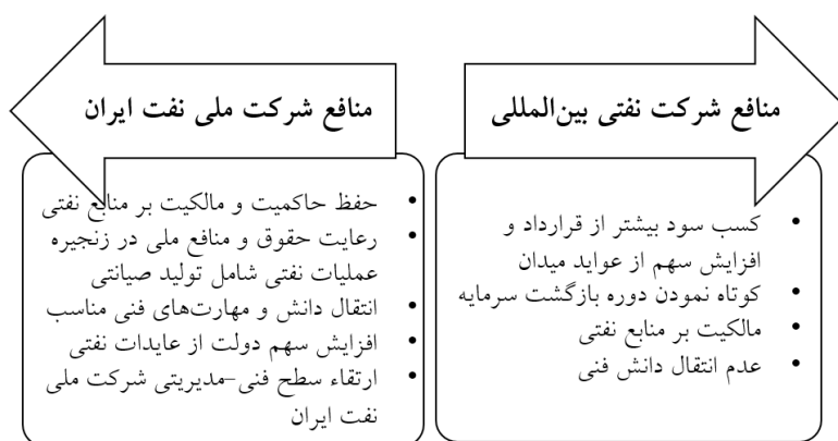
نمودار ۱. تضاد منافع شرکت ملی نفت و شرکت نفتی.

غالب قراردادهای نفتی تنظیم‌کننده روابط یک شرکت نفتی دولتی (NOC) مانند شرکت ملی نفت ایران و یک شرکت بین‌المللی نفتی (IOC) برای تعیین و تبیین نحوه سرمایه‌گذاری توسعه یک میدان نفتی و نحوه بازگشت سرمایه است. گرچه برای تأمین منافع ملی، شرکت ملی نفت باید به دنبال حداکثرسازی ارزش اقتصادی میدان در خلال عمر مخازن باشد، اما شرکت‌های نفتی به دنبال حداکثرسازی سود سهام‌داران خود براساس چارچوب اصول بنگاهداری در طول دوره قرارداد هستند (درخشان، ۱۳۹۳). شناسایی ریشه‌های پدید آمدن مخاطرات اخلاقی، مقدمه یافتن راهکارهای مقابله با کژمنشی در قراردادها است. وجود انگیزه‌ها و منافع ناهمسو بین طرفین قرارداد و همچنین اطلاعات نامتقارن و نقص قرارداد زمینه‌ساز بروز مخاطرات اخلاقی در زمان اجرای قرارداد هستند؛ بنابراین به منظور جلوگیری از بروز کژمنشی در قراردادها باید تلاش‌ها بر همسو نمودن منافع و انگیزه‌های طرفین قرارداد و همچنین جبران عدم تقارن اطلاعاتی از طریق ابزارهای نظارت و ارزیابی عملکرد معطوف گردد. نمودار ذیل مواردی از عدم هماهنگی بین منافع کارفرما و کارگزار در قراردادهای توسعه‌ای نفت و گاز را نمایش می‌دهد که با در نظر گرفتن تکالیف قانونی شرکت ملی نفت ایران و انگیزه‌های شرکت نفتی بین‌المللی، به عنوان یک موجودیت اقتصادی استخراج شده است.